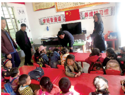
■孩子们在课堂上学习普通话。