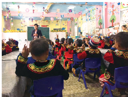
■北师大教育扶贫团队在布拖县拉达乡中心学校幼教点听课和授课。