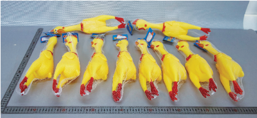
■发泄类玩具样品未通过所有安全项目检测。