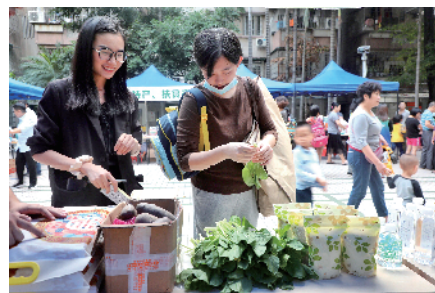
■ 街坊在选购农产品。

为了展示瘦身鱼的实力,陈国群和助手还带来了砧板,现场宰鱼、烹煮试吃。“一点也不腥,味道很鲜美。”一位白发婆婆很在行地吃鱼、喝汤,给出结论。