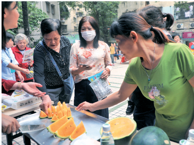
■ 黄瓢的黄帝瓜吸引了不少街坊。