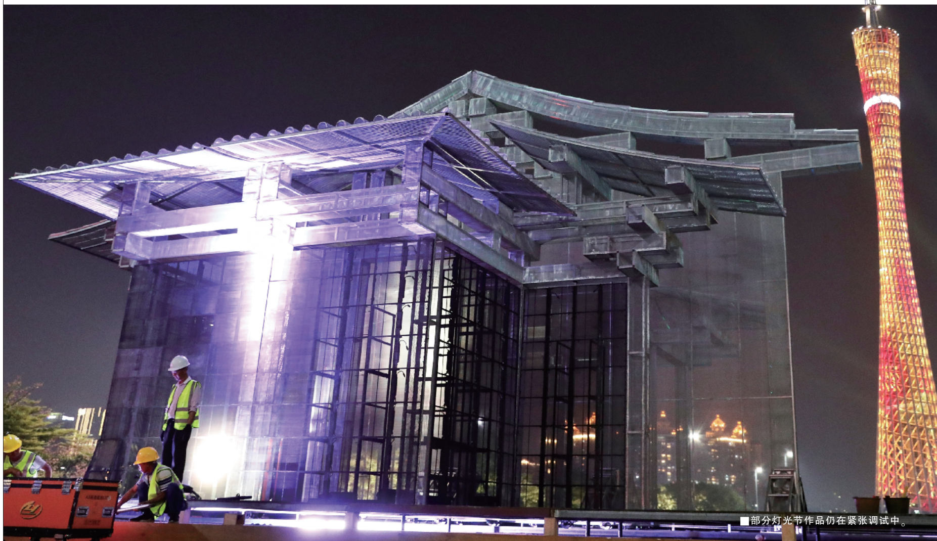
■部分灯光节作品仍在紧张调试中。