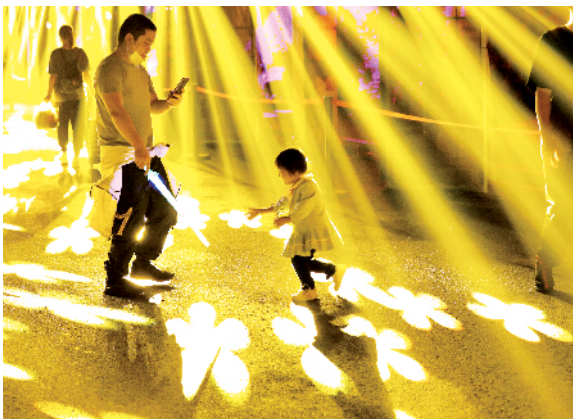
■昨晚,游客在灯光节试亮灯现场游览参观。