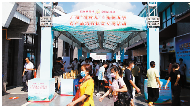
■今年7月24日,广州“驻村人”梅州五华农产品消费扶贫专场活动受到热捧。

截至目前,梅州市已有21家人选粤港澳大湾区“菜篮子”生产基地和两个加工企业入驻信息平台,而广东汉光超顺农业股份有限公司等210多家