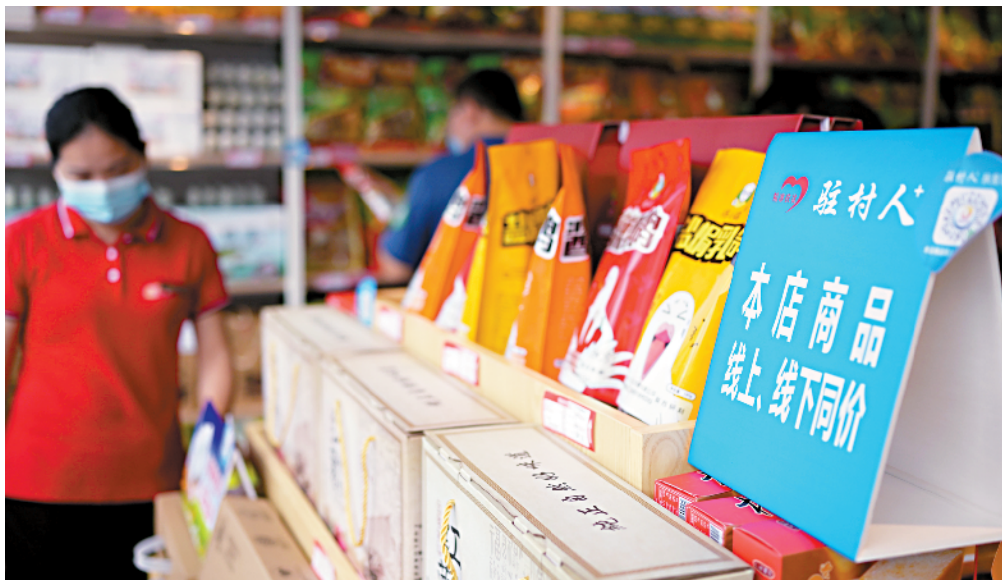
■广州北三环高速公路新安服务区的“驻村人+扶贫馆”,不时有客人光顾。 (资料图)

广州北三环高速新安服务区,古香古色的黛青色建筑群中,省内首个高速路消费扶贫展销服务平台——“驻村人+扶贫馆”落户于此。流心酥、富硒米、高山红薯、柚子脆片……广州对口帮扶梅州超过186种特色扶贫农产品在这里展销,这既是为梅货出山打通了通往粤港澳大湾区的高速通道,也是扶贫产品完全市场化运营模式的缩影和新模式的开创。“广梅一盘棋”通过全产业链的排兵布阵,已经取得了一定成效,而广州帮扶消费扶贫通道的进一步拓宽,则是促进巩固梅州脱贫攻坚成果及乡村振兴的关键所在。