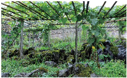
■ 贵州省黔南州惠水县好花红镇石头关村，佛手瓜种在石头里。