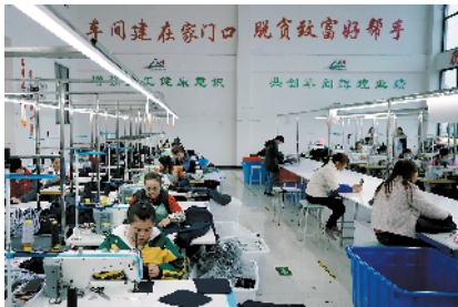
■ 贵州省黔南州惠水县扶贫车间。