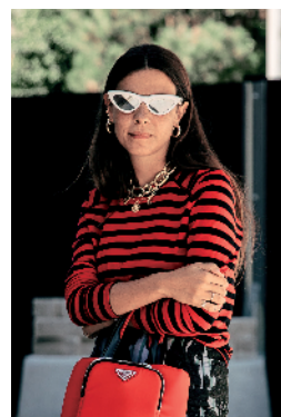
▲金属链条叠戴, 一粗一细的方式更有层次感, 不显寡淡又不会难驾驭。

金属链条腰带的搭配也是近年时装博主们很爱的方式, 往往只需要一根就足以让目光聚集于迷人腰间。如果你不喜欢大链条的粗犷感, 纤细材质的金属链条亦是不错的选择, 能让整体的造型显得更加细腻有力。