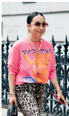
►珍珠与金属链条混搭, 遇见卫衣是闪耀 Rap Star, 搭配西装也可以又酷又美。