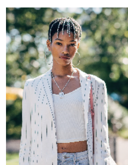
▲水钻用在编发中是今年新的尝试, 优雅与灵动兼备。

Disco 文化的回潮, 使得流苏、亮片、水钻等浮夸闪亮元素也回归。尤其是水钻, 在去年流行的字母发夹上高调了一整季。曾被嫌弃土掉渣的水钻如今已回到了潮人的身上, 无法低调的闪亮属性, 注定我们在搭配它的时候要多加点小心机, 才能看起来时髦不费力。