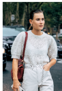
▲往年多数流行金色链条, 今年银色链条也提上了日程。