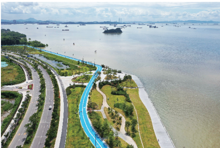
■广州市南沙区海滨路碧道。