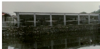
■当年的照片显示,被拆除的雨棚是简易建筑。

对于此事,有律师表示,房地产估价报告作为证据在法庭上开示之后就不再是秘密了。在估价对象已经灭失的情况,根据照片作出的估价,不能作为刑事案件的依据。