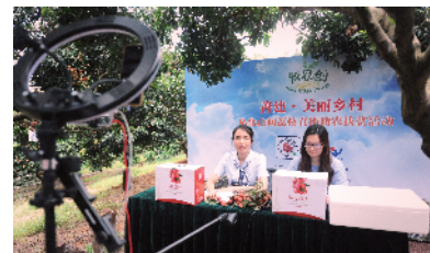
■从化荔枝直播带货助农。