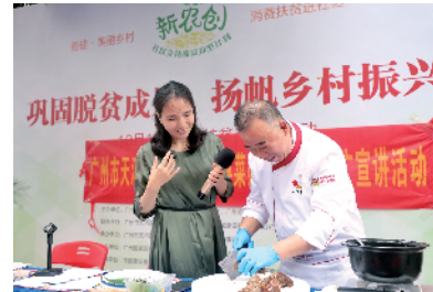
■“粤菜师傅”现场烹饪扶贫产品。