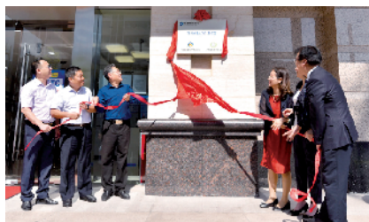
■广东首个“善融扶贫港湾”揭牌启用。