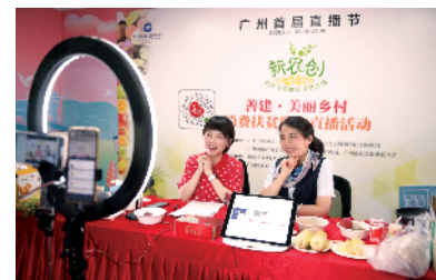
■广州建行直播节扶贫带货直播。

“新农创”项目发动社区潜力、“直播带货”促进消费扶贫,是建行广州分行不断创新精准消费扶贫方式的尝试,也是下沉服务重心,服务广州探索具有特色的超大城市乡村振兴之路的一个缩影。广州建行以新金融渗透到乡村生活的方方面面,走入广大乡村的地头田间,在助力脱贫攻坚的同时,为乡村走向振兴打下良好基础,架起脱贫攻坚和乡村振兴的“金桥”。今年以来,建行广州分行紧跟广州乡村振兴步伐,全面开展“善建·美丽乡村”行动方案,在助力乡村振兴的路上不断前行。围绕乡村振兴发展需求,建行广州分行推出了全面服务广州市乡村振兴行动方案,开展“善建·美丽乡村”计划,建立“绿色金融+乡村”发展机制;与政府部门携手打造“智慧乡村”,推动乡村政务服务一体机走入广州100条特色村;建设“裕农通”金融服务点,服务范围涵盖广州市一千余个行政村、城乡接合部工厂、园区等区域;盘活乡村新业态,创新“三环授信”模式支持乡村产业发展,助力打造宜居宜业宜游的美丽乡村。截至10月初,建行广州分行乡村振兴实现涉农贷款新增超40亿元,在助力乡村振兴路上不断前行。