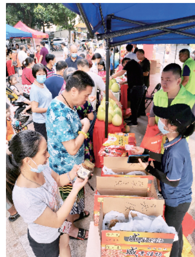
■“新农创”扶贫产品进社区。