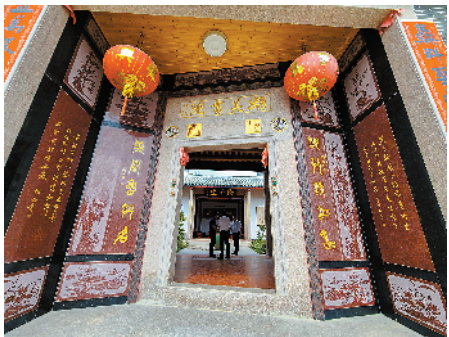
■潮州市潮安区凤塘镇湖美村新建的湖美书院。