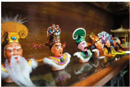
■栩栩如生的铁枝木偶头。