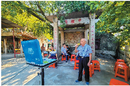
■潮州市潮安区金石镇,村民在文化广场唱潮剧。