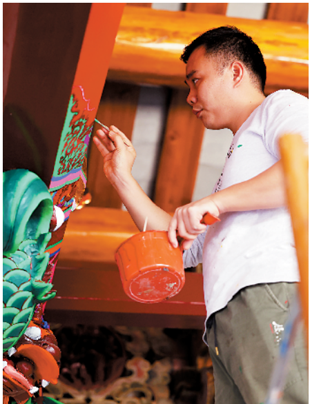
■工作人员对潮州市潮安区金石镇田头村凉州府内的文物建筑进行修缮。