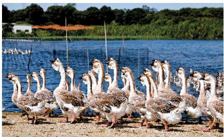
■阳江市江城区华陈村建种鹅养殖基地,带动贫困户增收。