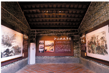
■埠场镇那蓬村的关山月作品馆。