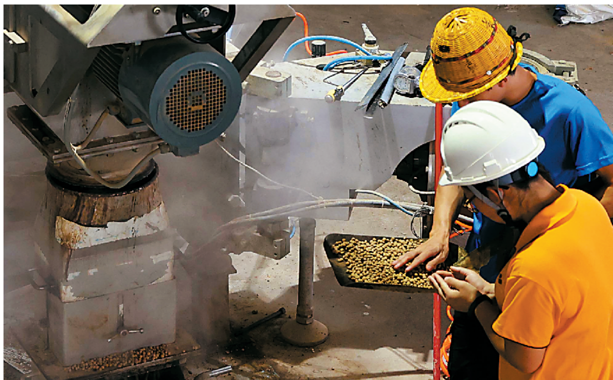
■丰顺新希望生物科技有限公司的饲料生产车间。