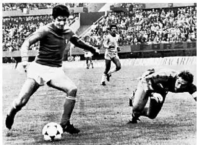
■保罗·罗西(左)参加 1978 年世界杯。

亚足联规定,被提前淘汰出局的球队,在酒店的住宿费用要自理,每支球队的每日开销都在人民币 10 万元左右。这对申花、上港和恒大俱乐部来说也是一笔不菲的支出。然而,随着国安的出局,中超四队都没有了比赛任务,而中超四队所下榻的酒店将会在四支球队的比赛全部结束后的 48 小时后解封,届时酒店将不会只接待中超这四队的人员,而是重新对外营业。也就是说,最晚 12 月 13 日,其他客人就可住进这家酒店。毫无疑问,这增大了中超球队的防疫难度,届时恒大、申花、上港和国安四队的回国之路会变得更难。