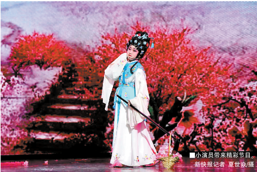
■小演员带来精彩节目。

本次展演为广大爱好戏曲的中小學生提供了展示舞台,让他们近距离感受到戏曲艺术的魅力,带来了美的视觉享受,也激发青少年学习传统戏曲的兴