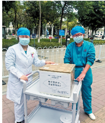
■捐赠漱口水,帮助 一线医护人员建立 第一道健康防线。