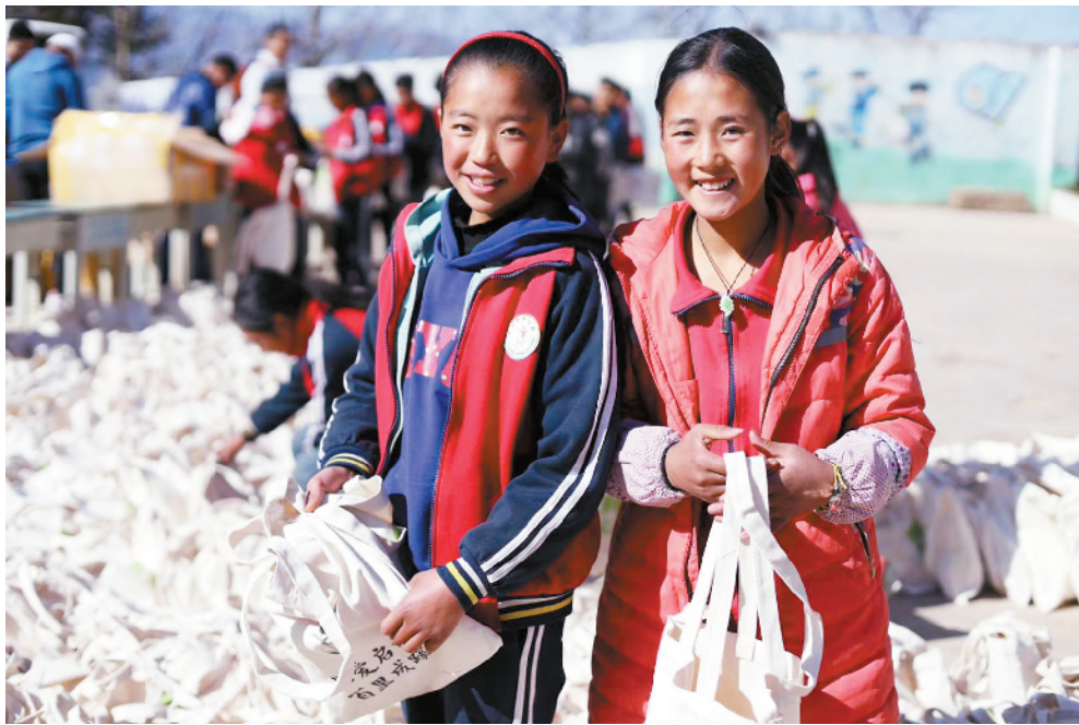
■康乃馨健康计划,关爱偏远地区的女性生理卫生健康。

对他们这些散落在人间的“白衣天使”而言,艺和益,皆为修行。艺是技艺,是职业的技能与操守;益,是爱心,是勇气,是让更多人走向光明未来的责任。