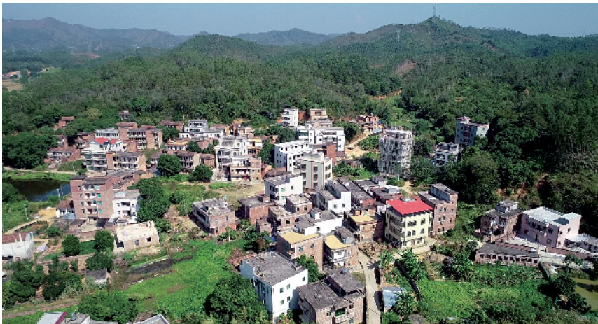
■在珠海高新区的帮扶下,大石头村焕然一新。