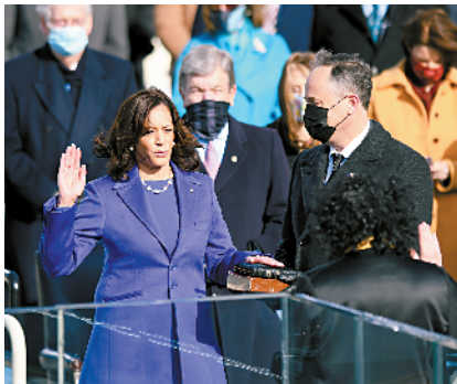
■哈里斯宣誓就任美国副总统。

针对美国不断恶化的新冠疫情,拜登下令在联邦建筑内戴口罩和保持社交距离,敦促州政府和地方政府采取同样措施,呼吁美国民众在100天内坚持戴口罩。拜登戴着口罩签署行政命令,与特朗