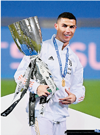
■C 罗在颁奖仪式后庆祝。

本场比赛的功臣 C 罗在赛后表示:“我们很高兴,这场比赛赢得并不轻松,这个奖杯很重要,希望它能为尤文图斯带来信心。”那不勒斯教练加图索则在赛后安慰了因西涅,称他不应该责怪自己。