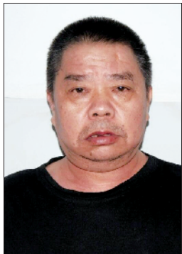
无名氏,男,约60岁,户籍不详。