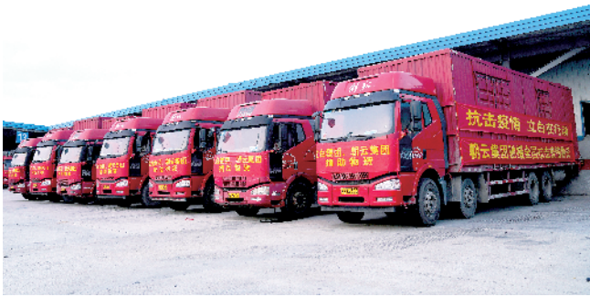
■疫情爆发初期,立白集团快速向全国2000多家定点收治医院捐赠价值2亿元消毒除菌产品,并自行配送。