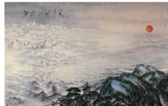
■关山月、傅抱石《江山如此多娇》1959年