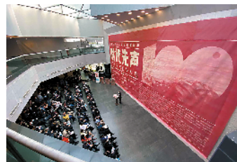
■展览现场

为庆祝中国共产党成立100周年,在广州市委、市政府的领导和市委宣传部的指导下,广州市文学艺术界联合会组织全市广大文艺工作者开展回望百年步履、重忆听党话跟党走的光辉历程,沉潜广州文艺家的初心与使命,更加深刻领会中国共产党领导是中国特色社会主义最本质的特征,是中国特色社会主义制度的最大优势。由广州市文联、广东美术馆主办的“时代先声——广州文艺百年大展”,以时间为轴线,以事件、人物和作品为顺序的呈现方式,分为“早天雷·心向光明(1921-1949)”“得胜令·红棉璀璨(1949-1978)”“风云会·南国春早(1978-2012)”“步步高·出新出彩(2012-2021)”以及“广州文艺百年大事记”“广州文艺百年大家”“广州文艺经典影像馆”七大板块。通过现当代的文艺精品、历史文献、报纸期刊、名人信札、音像实物等1000余件珍贵藏品,以纪实性、史料性、艺术性,真实展示了百年来在中国共产党领导下广州波澜壮阔的文艺史实和灿烂辉煌的文艺创作成就。此外,还汇编整理了百年来有关广州文艺研究的学术文献,构成了百年大展的学术基础,并配套出版广州文艺百年书系。既充分反映了岭南文化中心广州文艺的历史发展进程,更真实呈现了南国大地一幕幕驰魂宕魄的辉煌与荣光。