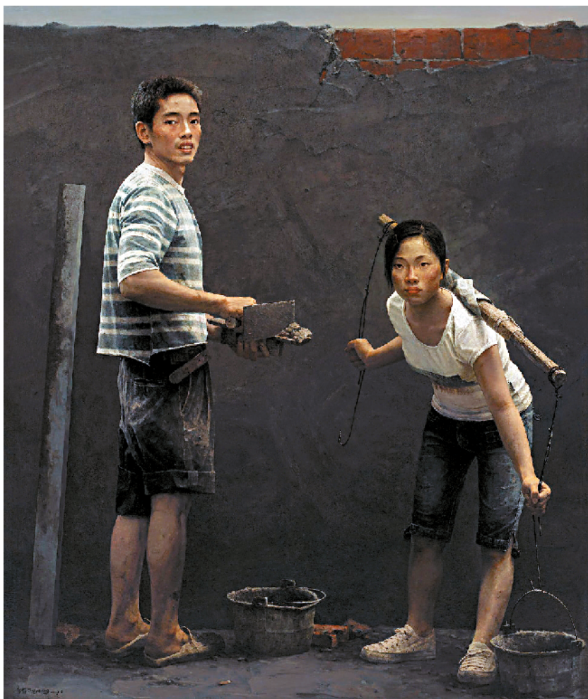
■李节平《小夫妻》获第十一届全国美术作品展金奖