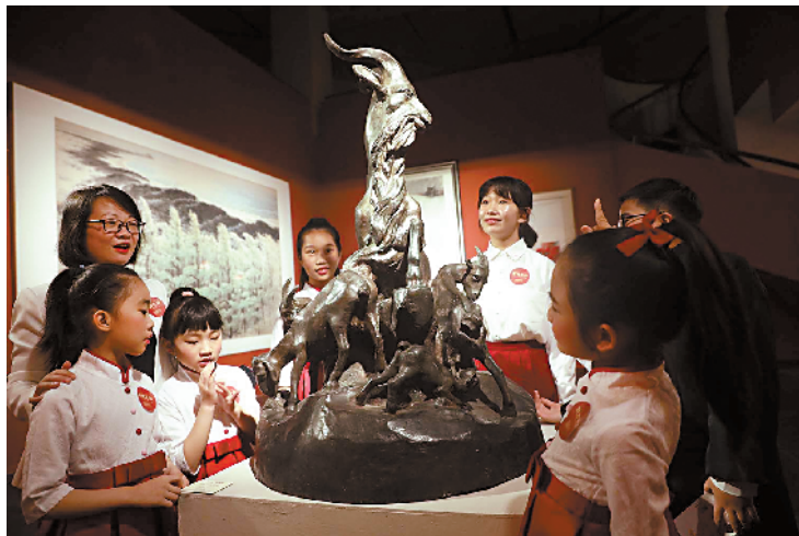
■1月26日,“时代先声——广州文艺百年大展”在广东美术馆开幕,展览吸引了众多观众前往观看。