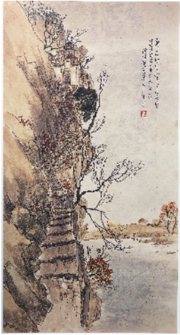
◀◀高剑父中国画 东战场的烈焰

商衍瀛、朱汝珍等,碑帖合流的书家罗惇融、罗复堪、王秋涓等,博通文史的书家叶恭绰、黄节、易孺、陈垣、邓尔雅等。