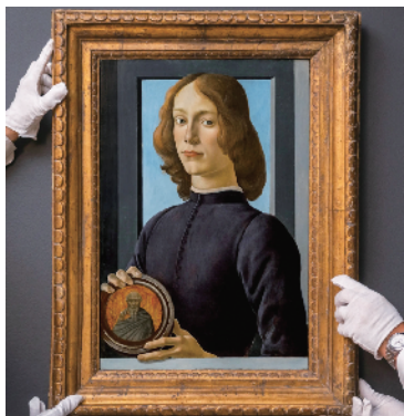
■波提切利 手持圆形圣像的年轻男子

1月28日,2021年全球首场重要拍卖在纽约拉开帷幕。在苏富比“西洋古典艺术周”的“大师绘画 & 雕塑 I”专场中,最大惊喜莫过于文