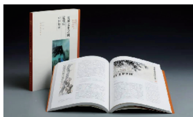
方闻中国艺术史著作全编 《两种文化之间:近现代中国绘画》 方闻 著;赵佳 译 上海书画出版社出版