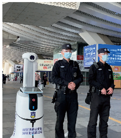
■“防疫机器人”首次亮相深圳北站。

人”支持远程 APP 控制,可对体温异常和未佩戴口罩的旅客发出警报声提醒,一旦出现涉疫警情,防疫机器人会第一时间对涉疫场所进行消杀,消杀标准可达手术室级别,且消杀喷雾对人体无害。防疫机器人每晚还会对车站候车室、售票厅等重点场所定时定点进行 360 度无死角消毒,为春运防疫保驾护航。