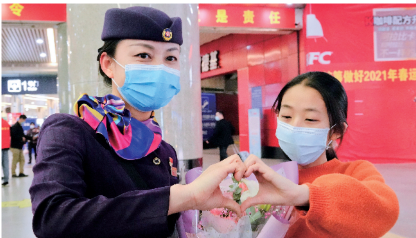
■“列车宝宝”和妈妈一起,带着防疫物品来看望“铁路妈妈”。