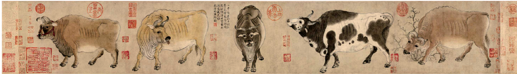
■韩滉 五牛图 故宫博物院藏