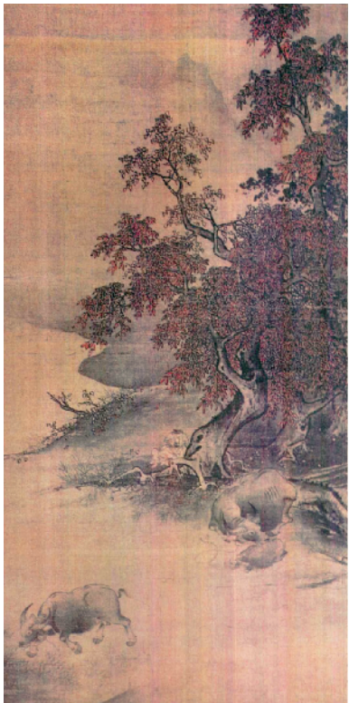
■南宋 李佑 牧牛图

据研究资料显示,清代画史中记载专事画牛的画家还有:“陈景、杨晋、熊怡、朱涧南等人。《国朝画征录》中记载陈景“善画牛,人争称之”。传世作品中画牛佳作诸多。从这些传世作品来看,画家大多追求所谓“逸笔草草,不求形似”的单纯化表现,尤其是高其佩,以其有别于先贤的指头画新技法创作出牛在指与墨中的世界,力图使艺术语言更能反映出自己思想和内在经验中“牛”的生动造型。有研究认为,明清时期画牛作品反映了清代画坛在水墨占主流的情势下,文人们视色为俗的观念。