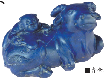
■青金石牧童骑牛 清