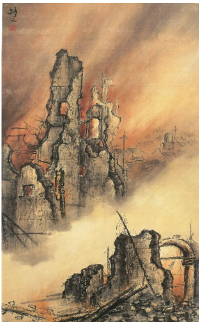
■高剑父 东战场的烈焰

梁江: 在新中国诞生之前已有众多红色经典之作。人们耳熟能详的如:高剑父《东战场的烈焰》;李桦《无家可归》《怒吼吧!中国》;廖冰兄“猫国春秋”组画;赖少其《抗战门神》;黄新波木刻连续画《老当益壮》;罗工柳《夜袭》、《李有才板话》插图;古元《焚毁地契》《农民踊跃交公粮》《人桥》等等。新中国70年来广东的著名作品,如黎雄才《武汉防汛图卷》(国画)、潘鹤《艰苦岁月》(雕塑)、胡一川《前夜》(油画)、黄新波《年青人》(版画)唐大禧《欧阳海》(雕塑)雷坦《飞夺泸定桥》(油画)杨之光《矿山新兵》(国画)、汤小铭《永不休战》(油画)潘嘉俊《我是海燕》(油画)陈衍宁《毛主席视察广东农村》