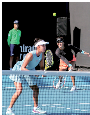
■张帅/斯托瑟止步首轮。

相比较而言,39 岁的小威廉姆斯发挥极为稳定,她仅用 69 分钟便以 6:3、6:0 横扫塞尔维亚选手斯托扬诺维