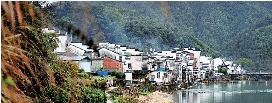
■白墙黑瓦的徽派建筑给婺源增添了古色古香的质感,这使婺源成为春节期间自驾游的打卡胜地。

江西婺源以“地近婺源之源”而得名。这里有白墙灰瓦、绿水青山、古意盎然的徽派民居。春天,油菜花漫山遍野开得绚烂。近年来,随着乡村旅游的发展,婺源的美被更多人所熟知,被誉为“最美乡村”。我是土生土长的“90后”婺源人,无论在外求学还是来广州工作,每年都回家过年,今年已经是连续第二十六年在婺源过春节了。在我看来,婺源的春节在悄然发生着变化:往年,人们过年常常走亲戚,如今越来越多人喜欢自驾游。