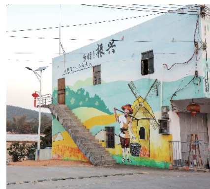
■ 惠州市惠东县多祝镇八维村吸引越来越多游客来村里观光旅游。

“加大产销对接的广度和力度，让更多人爱上惠东的好产品，帮助我们的农产品、旅游产品进入更广阔的市场。”惠东县扶贫办有关负责人表示，接下来，惠东县将继续推动政府单位和社会各界参与消费扶贫，培育建设一批对接市场、服务农村的电子商务等消费扶贫平台，进一步促进老百姓增产增收致富。