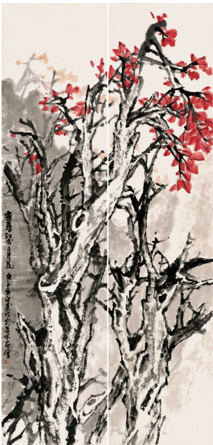
■卜绍基 春之消息 2020 年

2020 庚子年注定是一个不平凡的一年。岁初的新冠疫情突如其来,肆虐猖獗,全国人民众志成城、共克时艰,取得了抗疫的伟大胜利。我们艺术家也不甘人后,以各种艺术形式记录战役中的感人故事,歌颂最美逆行者。作为专业画院的艺术家,我在去年利用“宅家闭关”这段相对安静的时间,创作了不少大作新作。其中,以自己擅长的花鸟画创作了《春暖花开》《红叶傲风霜》《春之消息》等抗疫题材的主题创作,通过表现坚韧挺拔的枝茎和寒风中挺立的红叶,象征不屈不挠的抗疫精神,积极响应号召,以艺术形式开辟另一个战“疫”阵地。