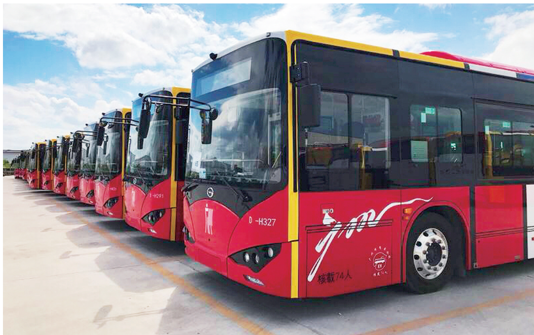
■广州公交集团着力打造 2020 年度优秀品牌示范线。

243 路线从广州市的革新路光大花园总站开往员村美林花园总站。线路自 1986 年开通至今已有 35 年历史,是电车公司市内首条汽车线路。线路秉承“党员先锋、暖心服务”宗旨,践行服务党建、服务社区、服务群众的公交服务理念,以优质的车型和良好的风貌为附近居民提供满意的公交出行服务,打造出党建+服务品牌。2020 年有 6 宗暖心服务事迹受到媒体报道,片长李智伟先进事迹被拍摄成广州抗疫宣传片在各大公众场合展播。