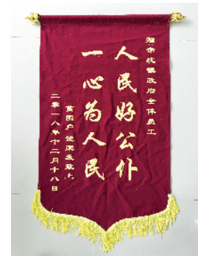
贫困户送来的锦旗。

就赤坑镇来说,赤坑镇是生态镇,没有工业,土地也比较零散,很难发展规模种植和养殖业。她透露,县镇已规划在赤坑镇最边远的惠爱村建设一个大的文旅项目,打造农产品特色街,结合“一村一