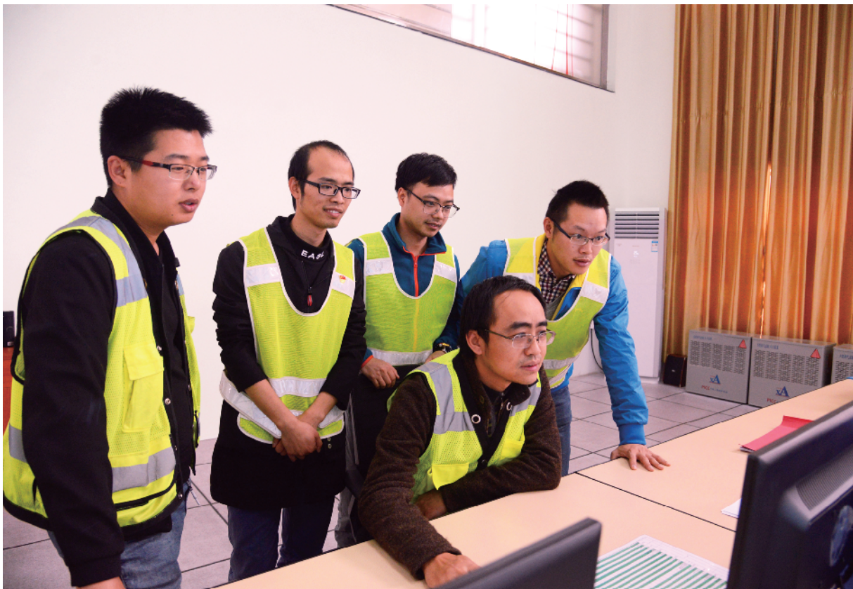
■技术生力军团队正在工作中。