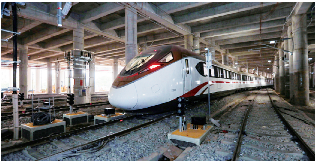
■乘坐地铁十八号线南沙半个钟到广州主城区。

新快报讯 记者李佳文 通讯员林佳 唐国立 陈思报道 时速 176 公里! 3 月 7 日,广州地铁十八号线成功完成逐级提速试验,试验中的运行最高速度刷新了国内地铁试跑的最高速度纪录。