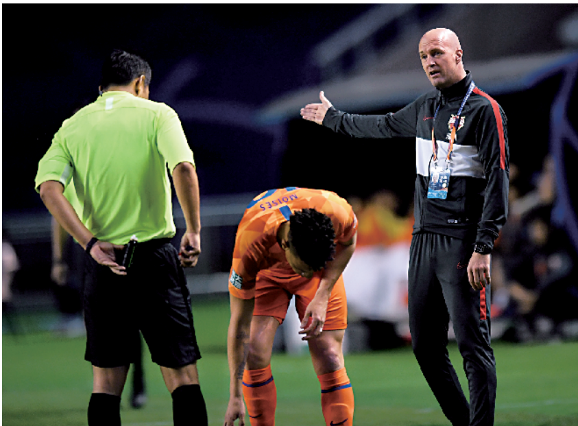
■克鲁伊夫在中超赛场临场指挥深圳队。

从小克最近两份的合约中能看出他的巴萨情结。另外,小克的体育总监经验非常充足。自 2010 年退役之后,小克在雅典 AEK(希腊)和特拉维夫马卡比(以色列)都做过总监。相比作为主帅所取得