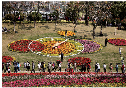
■白云山风景区云台花园