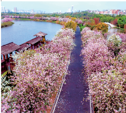
■梦幻一般的宫粉紫荆道。

对了，倘若逛累了，还可以到海珠湖公园里的沙河粉村体验馆来上一份干炒牛河，一边品尝着非物质文化遗产的美味，一边静观湖水飘摇、时光荏苒，如此游走，完美！