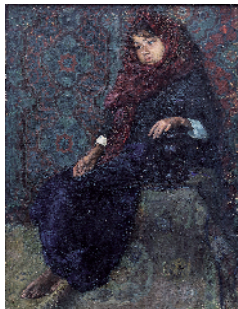
■曾松龄 扶罐子的女孩

“朴素的意义——曾松龄作品展”3 月 5 日在广州美术学院美术馆开幕,广州美术学院美术馆常务副馆长胡斌在前言中写道,“他的风景画用色丰富,讲究简括自然,充盈着一股明朗清健的抒情意味。而新时期尤其是上世纪 90 年代以来,他的风景画越来越占据主要位置,描绘崖石江海的场景日益增多,而画面的诗意也日渐凸显。他的水彩画多为水气充沛、色彩明丽润泽一路,于寥寥数笔、水色流溢间呈现景致的丰富面貌。他晚年多作国画,亦是在笔致错落有序、色墨交汇之中写就各种云山村寨之情状。总体说来,他的作品多以日常平凡事物和景象为题,造型坚实却不板滞,色彩绚烂而不聒噪,以一种一以贯之的具有某种书写性的写实来呈现其所见所感。”(梁志钦)