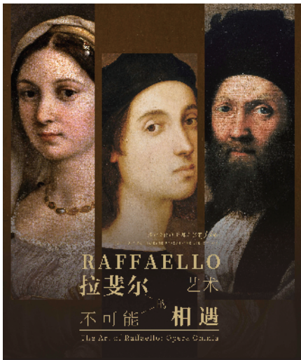
■“拉斐尔的艺术·不可能的相遇”展览海报

作为文艺复兴三杰之一,拉斐尔在世人眼中无疑是“祖师爷赏饭吃”的代名词。他被誉为文艺复兴盛期的集大成者,代表了文艺复兴时期艺术家从事理想美的事业所能达到的巅峰,逝世时年仅 37 岁。他一生给世人留下 300 多幅珍贵的作品,包括著名油画《西斯廷圣母》、壁画《雅典学院》等。