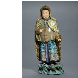
■清 陈渭岩 瓷塑粉彩亲王像