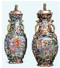
■清乾隆 广彩锦地开光仕女婴戏图堆塑花枝耳狮钮对瓶(一对)