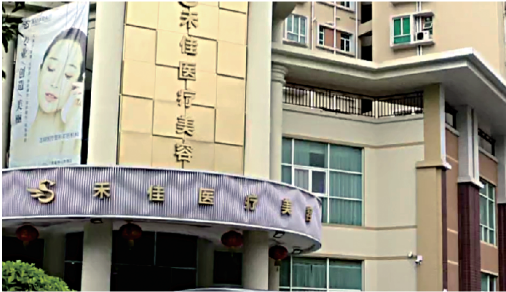
■ 中山禾佳医疗美容机构推出9.9元小气泡美容项目,消费者到店后却被告知要加钱办套餐,甚至引导做美容贷。

律师提醒,美容贷是美容机构风险转嫁的手法。机构在不告知消费者的情况下擅自帮其进行贷款,涉嫌强迫交易。一旦发生纠纷,维权也困难。消费者可进行投诉。