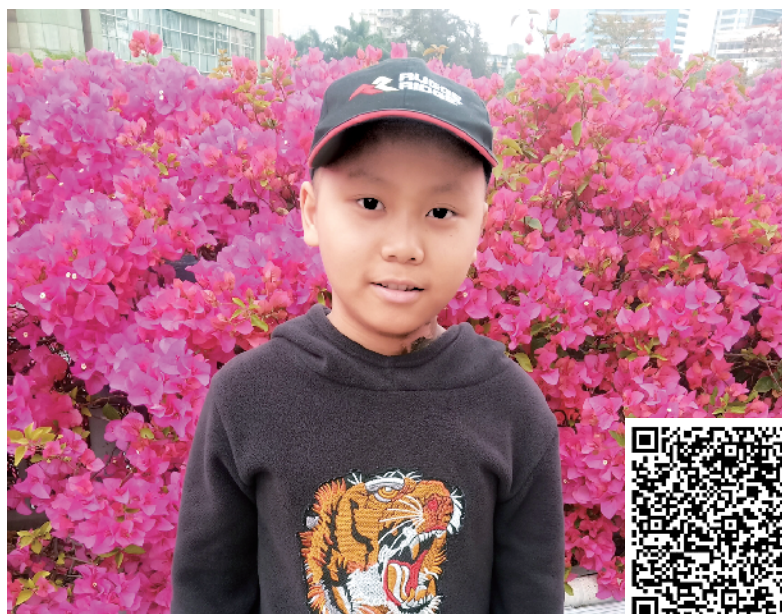
■经过休整,超劲即将面对第 11 次化疗。

从去年 9 月至今今年 2 月,超劲已经接受了 3 次放疗和 10 次化疗。虽然农村医保有四五成的报销,但自费部分已经超过 10 万元。“因为爸爸辞职,全身心在广州陪医,这些钱都是从亲戚朋友处借来的。”冯洁珍精打细算地节省着每一元钱,在广州只敢租每天 80 元的单间居住。尽管如此,每月仍要耗费 2400 元房租,治疗费用依旧拮据。