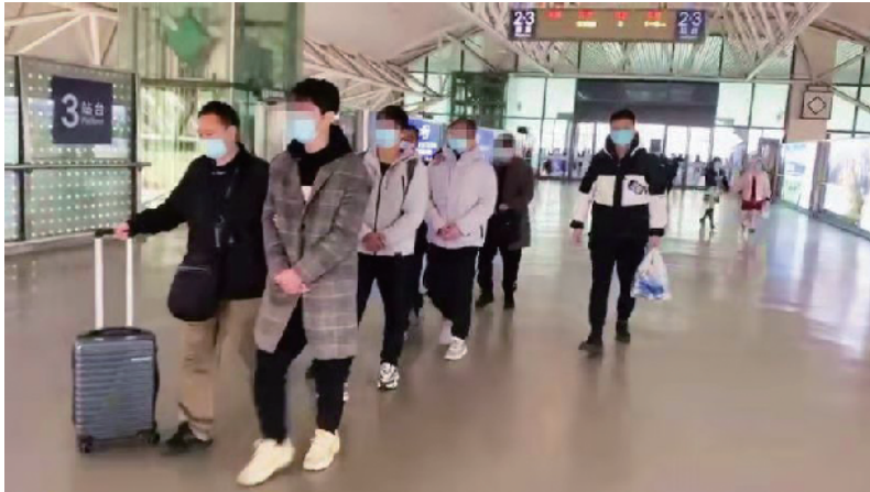
▲专案组民警抓获犯罪嫌疑人。