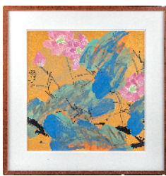
■陈天 荷花 (捐赠人:陈天)