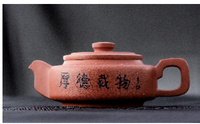
■高群 紫砂壶 (捐赠人:林浩贤)