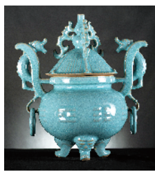
■朱法喜 汝窑八卦鼎 (捐赠人:朱晓燕、朱晓辉)