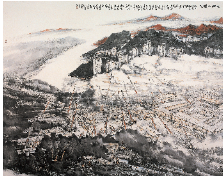
■黄唯理 火神山曙色 145×182cm 2020年

黄唯理 广东画院一级美术师。中国美术家协会会员,广东省美术家协会中国画艺委会副主任,广东省中国画学会副秘书长,广东技术师范大学及广州大学客座教授、硕士生导师。