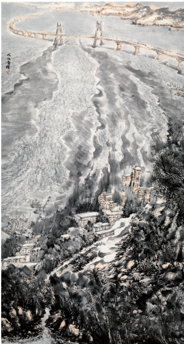
■黄唯理 潮声 80×97cm 2018年

念,创作了大量的现实题材精品力作。”林蓝向建设者讲述疫情以来画家们以画笔投身抗疫的事例,她说:“通过投身抗疫及当今的建设,我们能够看到每一位建设者的辛勤付出。我们的美好生活因建设者的负重前行而换来,我们愿意为他们而讴歌。”