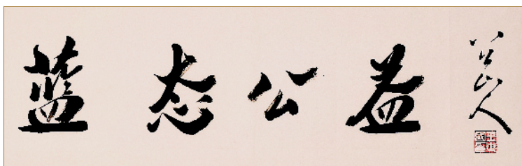
■王世国题匾《蓝态公益》