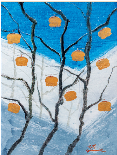
■尚钧鹏 金柿吉祥 (捐赠人:尚钧鹏)

张华: 我们希望,通过这间艺术馆更好地将艺术品、艺术家、社会各界人士与基金会联系起来,促进艺术与慈善的结合。艺术馆将会持续举办艺术展,征集收藏名家作品,开展交流艺术活动。这既符合弘扬优秀传统文化的宗旨,又是更高层次的文化活动。我相信,蓝态艺术馆必将成为艺术之家,成为艺术品最好的归宿,成为艺术家奉献爱心、服务社会的舞台,成为大众美育的课堂。