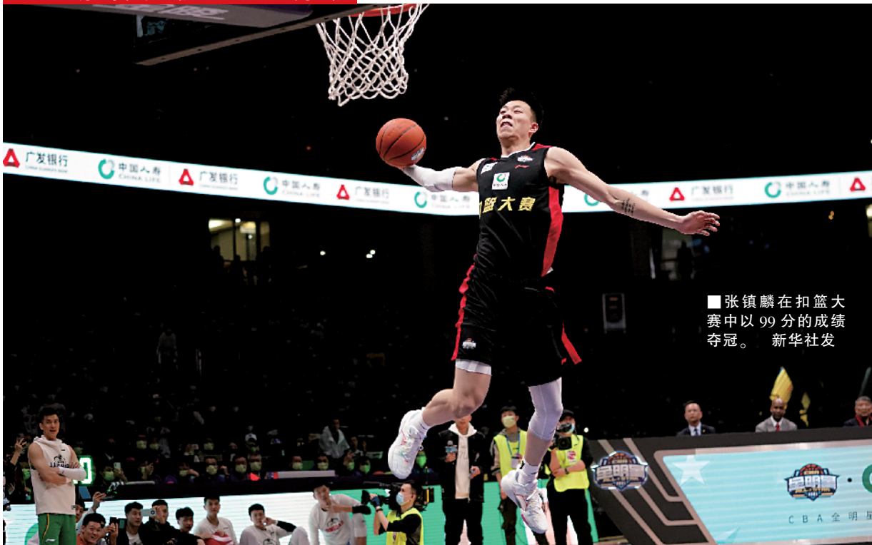
■张镇麟在扣篮大赛中以 99 分的成绩夺冠。