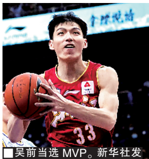
■吴前当选 MVP。

新快报讯 记者高京报道 昨晚,第 25 届 CBA 全明星周末正式落幕,南区队在下半场发力,最终以 123:109 击败北区队。南区队球星吴前在外线 13 投 7 中收获全场最高的 23 分,外加 5 次助攻,最终获得 MVP 奖杯。