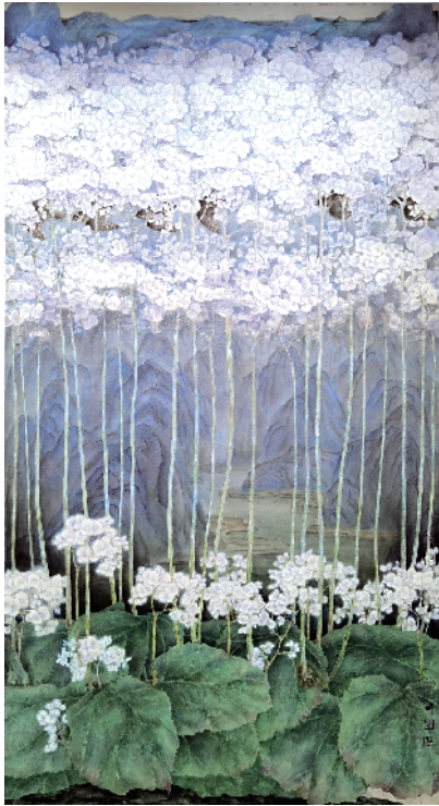
■ 霍昕愉 馥郁春润