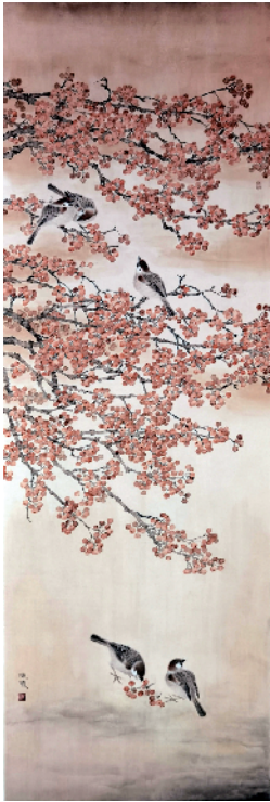
■ 区泳仪 秋日冬青