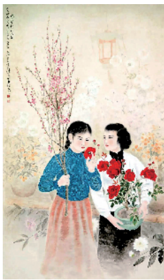
■方人定 花市灯如昼 1956年

1949年以来,广东地区的艺术家们以高度的社会责任感与历史使命感积极探索新的语言,开拓新的题材,表现时代主题,以美术特有的图像语言形式塑造构建了国家与人民的新形象,创作了大量紧扣社会脉搏、反映时代精神的美术作品,留下了有着深深时代烙印的文化记忆。本次展览从广东美术馆馆藏作品中遴选出了近一百件精品力作,包括何香凝、关良、方人定、黎雄才、关山月、廖冰兄、赖少其、黄新波、杨之光、王肇民、胡一川、郑爽、王玉珏、陈永锵、陈金章、林墉、林丰俗、许钦松、李劲堃等艺术家的作品,按照1949—1978年、1978—1999