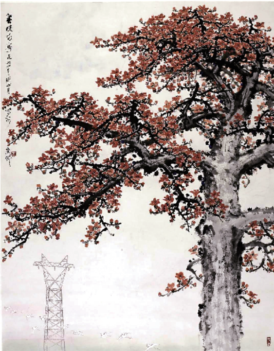
■关山月 春暖南粤 1974年