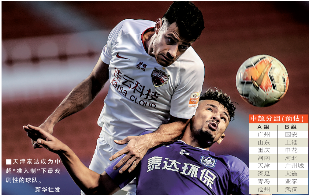
■天津泰达成为中超“准入制”下最戏剧性的球队。