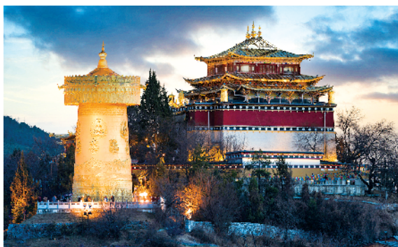
■香格里拉独克宗古城龟山公园。

客房内饰上精心挑选的转经筒、金刚结等藏地文化中的吉祥之物,更为住客营造出幸运随行的美妙感觉。