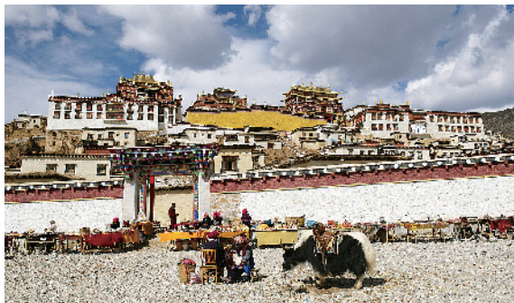
■香格里拉松赞林寺