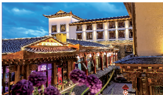
■司藤同款酒店:香格里拉第5颗陨石酒店外立面每一栋建筑的横梁、门窗、屋檐、墙面,都被藏式彩绘装点得美轮美奂。

2021年伊始,热播剧一部接一部袭来,前有豆瓣评分高达9.4、上映12天以9亿元人民币成绩夺得排行榜榜首的脱贫剧《山海情》,后有首播次日飙升电视剧热播榜第一位的《赘婿》,接着又有仅上线三天就收获36个微博热搜的《司藤》——“用八倍镜看剧”的热心观众不但从中扒出了各种剧情细节亮点,更有剧中同款目的地。