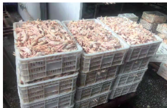
■“飓风 9 号”走私冻品专案,警方缴获部分涉案冻品。