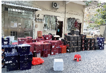
■生产销售假酒系列案中,警方查获部分假酒。