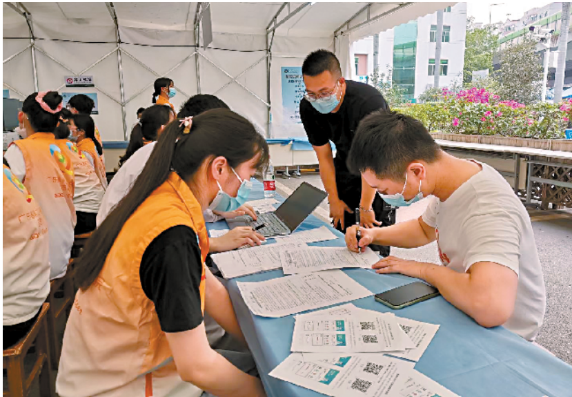
■广东省第二人民医院新冠疫苗接种点现场。

态在交通便利、人口相对集中的区域,如体育馆、会展中心等公共场所设置大型临时接种点,保障疫苗供应,集中接种,快速提升单日接种量。对于其他人口较少的地区,则多渠道开放预约途径,主要依靠固定接种点,方便重点人群接种。